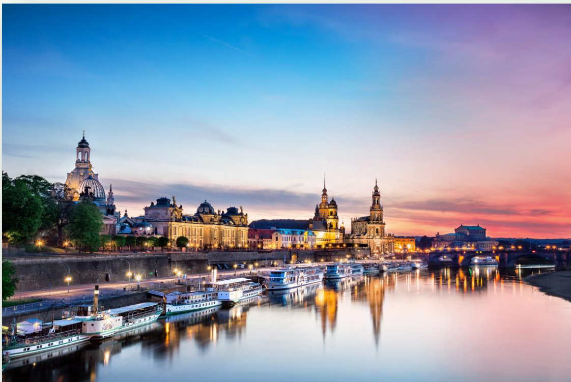
Stadtsilhouette im Abendlicht.

Die wunderschöne Canaletto Kulisse lädt ebenfalls zum Joggen, Inlineskaten, Radfahren und vielem mehr ein. Gut ausgebaute Wege inmitten der Natur führen entlang der schönsten Sehenswürdigkeiten Dresdens. Der perfekte Ort um dem Alltagsstress zu entfliehen.