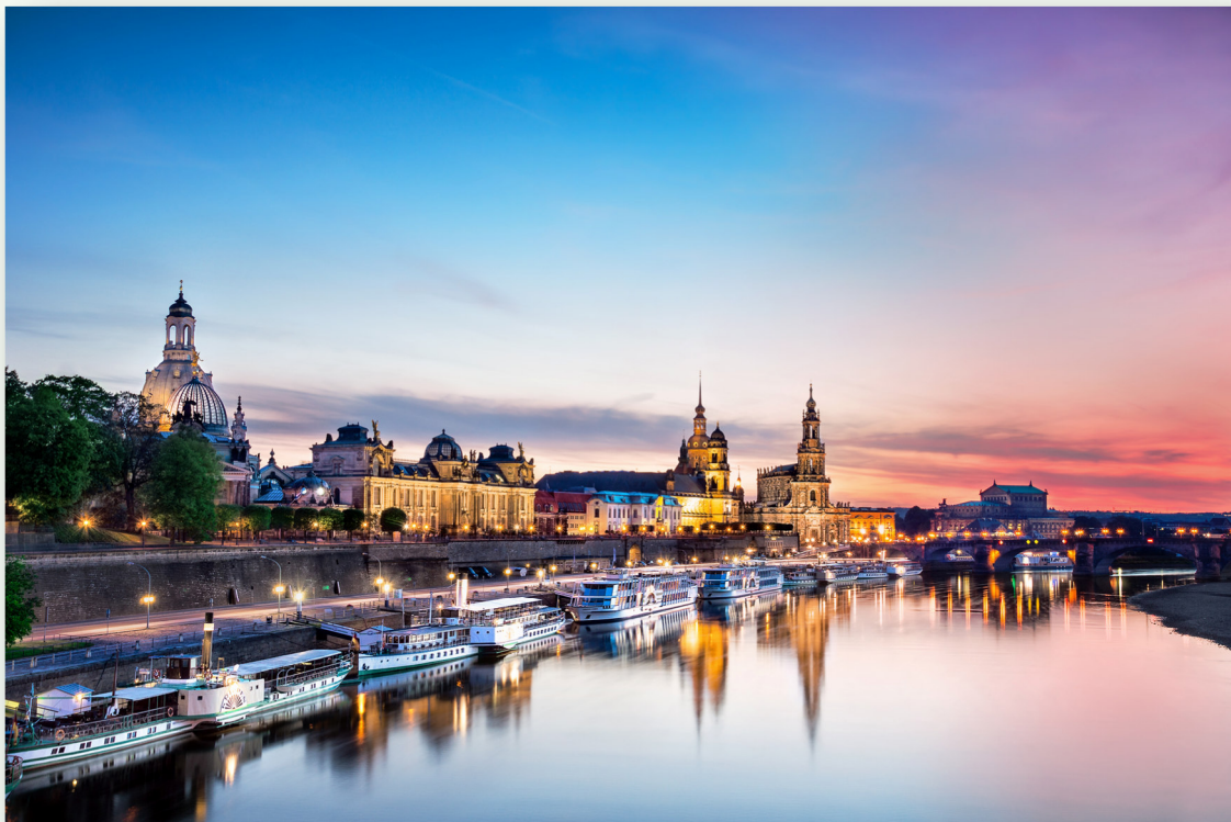
Stadtsilhouette im Abendlicht.

Die wunderschöne Canaletto Kulisse lädt ebenfalls zum Joggen, Inlineskaten, Radfahren und vielem mehr ein. Gut ausgebaute Wege inmitten der Natur führen entlang der schönsten Sehenswürdigkeiten Dresdens. Der perfekte Ort um dem Alltagsstress zu entfliehen.